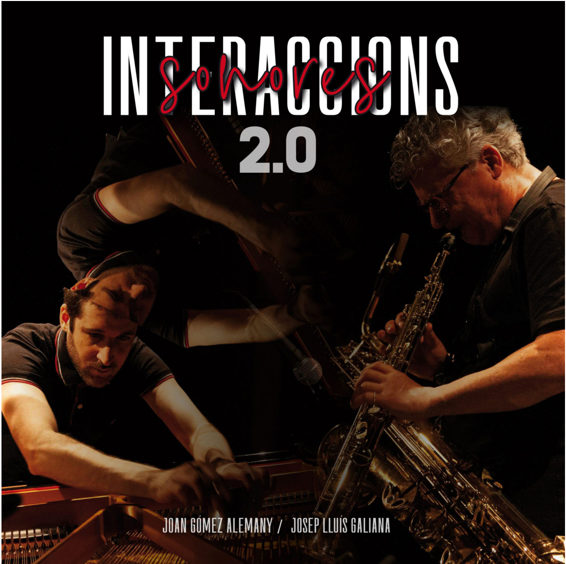
GALIANA, Josep Lluís y GÓMEZ ALEMANY, Joan (2024). Interaccions sonores 2.0 . Valencia (España): Liquen Records. Disponible en: https://liquenrecords.bandcamp.com/album/interaccions-sonores-20 https://liquenrecords.com/2024/11/28/interaccions-sonores-2-0-joan-gomez-alemany-josep-lluis-galiana/